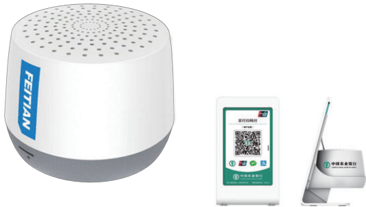
QRコード決済スピーカー