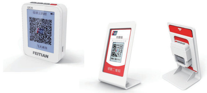
動的QRコード表示機